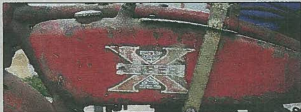
Super X var en motorcykel som i sitt hemland USA såldes under namnet Exelcior.