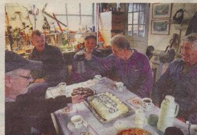
Busstårta. Fem år och många tusen timmar ideellt arbete firades med tårta.