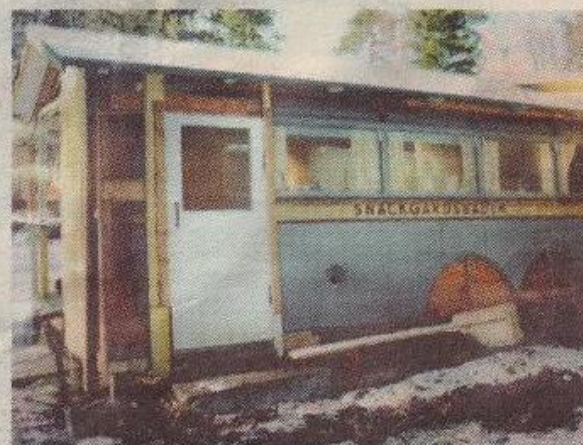
Husbuss. Sommarstugan i Tofta vilade på chassit till bussen.