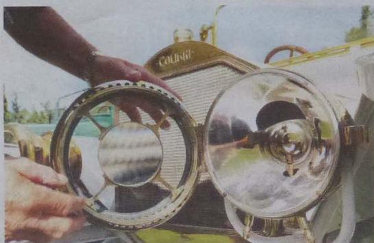
Cypern. Förstoringsglas från en järnhandel på Cypern passade perfekt i bilens framlyktor.