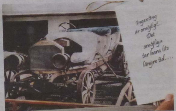
Motto. Åke drar sig inte för det som tycks omöjligt, det tar bara lite längre tid.