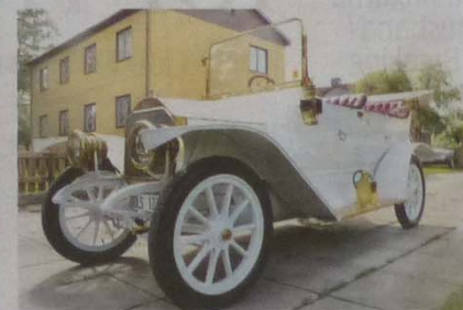
Nyskick. Efter ett oräkneligt antal timmar i verkstan kan Åke Ottosson åka riktigt ständsmässigt i den vita bilen med skinnade mässingsbeslag.