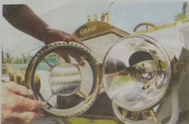
Cyperm. Förstöringsglas från en järnhandel på Cypern passade perfekt i bilens framyktor.