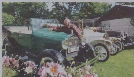
Bilpark. Två A-Fordar omger den unika tyska bilen av märket Colibri.