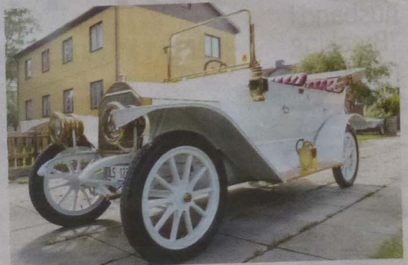
Nyskick. Efter ett oräkneligt antal timmar i verkstan kan Åke Ottosson åka riktigt ståndsmässigt i den vita bilen med skinande mässingsbeslag.