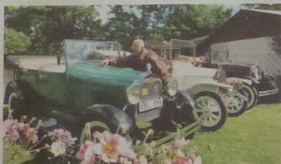
Bilpark. Två A-Fordar omger den unika tyska bilen av märket Colibri.